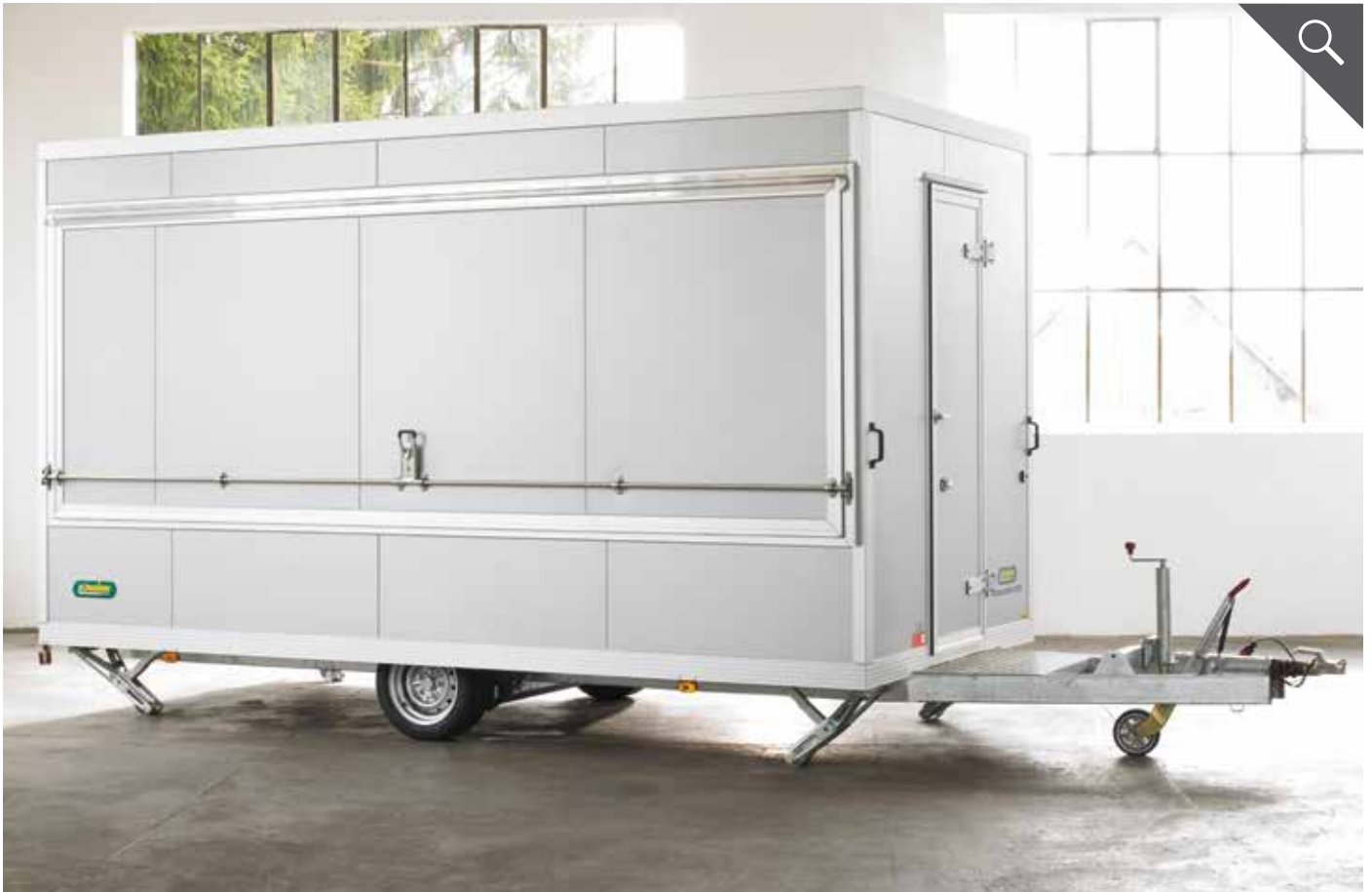
Seitenklappe mit Drehstangenverschluss