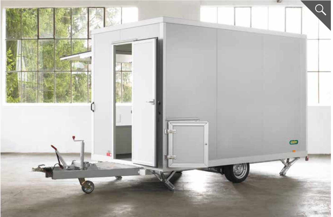
Rückansicht mit Gasflaschenschrank