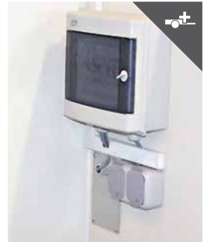
Sicherungskasten mit Steckdose