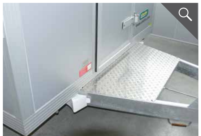
Auftritt auf Zugdeichsel