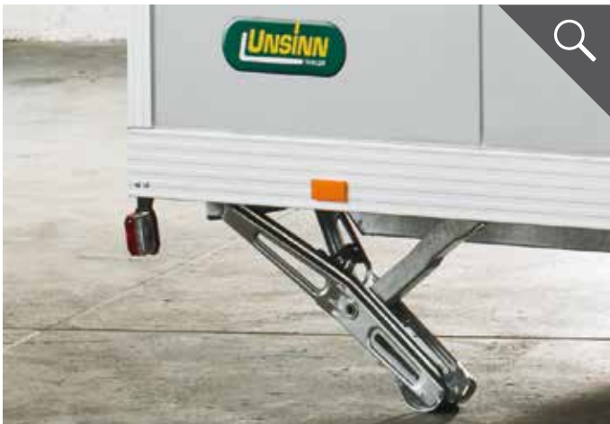
Scherenstützen unterhalb der Ladefläche montiert