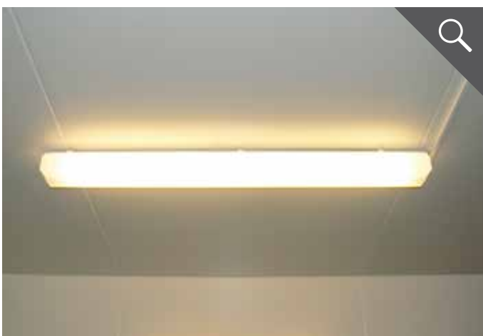
Innenbeleuchtung (230 V)