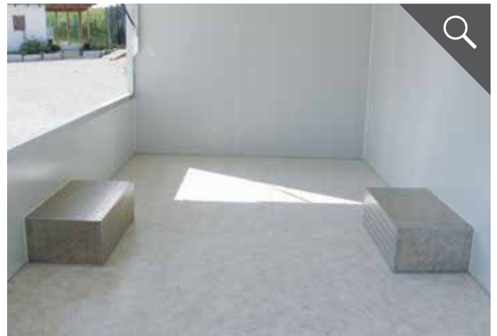
PVC Boden und Radkästen