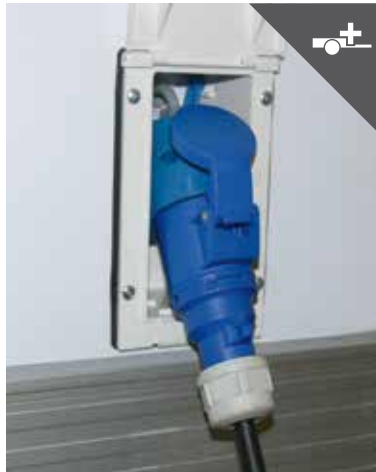
CEE-Steckdose 3-pol. 230V